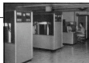
Un RAMAC avec deux armoires de 350 disques.