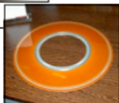
Un des disques du RAMAC

Lancé en septembre 1956, Le RAMAC était le premier ordinateur équipé d'un disque dur. Les informations étaient enregistrées sur des disques magnétiques de 60 cm de diamètre. La capacité du disque dur n'était que de 5Mo c'est-à-dire un 130ème de CD-Rom. Le RAMAC pesait plus d'une tonne et sa taille était équivalente à deux grands réfrigérateurs.